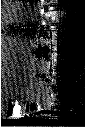
アールデコ様式の建築物がずらりと並ぶ町並み

そのホークスベイ地区の中で主要な町のひとつがネーピアです。1931年、ネーピアは大地震に見舞わ