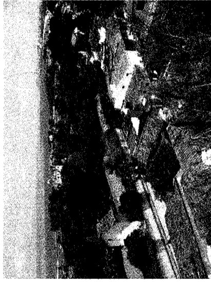
美しい街並みと海

ダによって24年間占領され、再びポルトガル領にと、波乱に富んだ歴史を歩んできました。二つの国の影響で、街には多くの教会と修道院が建てられています。