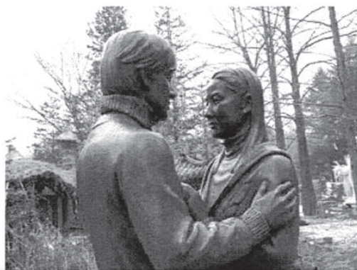
俳優や監督の銅像とも出会える

南怡島(ナミソム)は、ソウルから北東へ約50km、北漢江(ブクカンガン)という河に浮かぶ半月型の島です。四季折々の美しい景色を楽しめる豊かな自然とともに、ホテルや美術ギャラリー、キャンプ施設などもあり、韓国でも有数の行楽地として知られています。昔は対岸と陸続きで、洪水のときにだけ島になっていましたが、現在はダム建設により完全に独立した