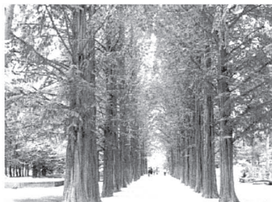
ドラマにも登場した「メタセコイアの並木道」