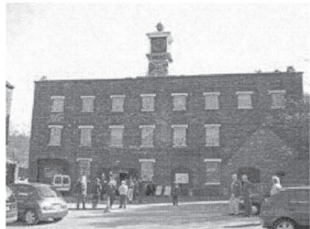
産業革命の繁栄を物語る コールブルックデール製鉄所博物館

それはまさしく、産業革命の幕開けでした。鉄やタイル、磁器の原材料になる石炭、鉄鉱石、石灰、粘土